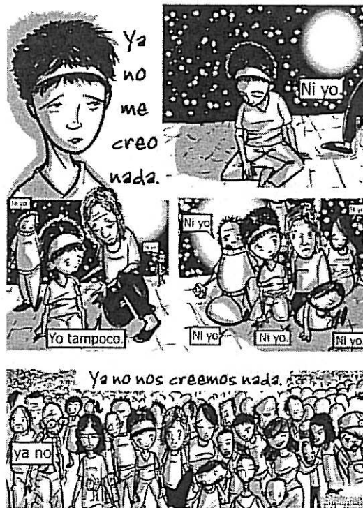
No estamos para cuentos.

bierno, al apelar a una gestión libre de toda coacción externa. Podemos hablar también de autogestión a nivel personal, aquella aspiración que, como individuos, nos anima a la independencia personal y grupal (con nuestros compañeros, familia, vecinos...) respecto a las instituciones del capitalismo o el Estado.